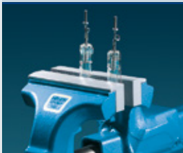
Tipo PR (Poliuretano grafilado)

La superficie de amarre está hecha de caucho sintético. Las piezas se amarran firmemente, incluso con poca presión.