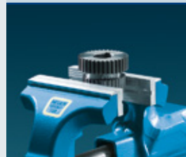
Typ N (Neutral)

Die Spannfläche besteht aus Fiber mit einer besonderen schichtweisen Struktur. Auch beim Spannen von erwärmten Werkstücken deformiert sich der Fiberbelag nicht.