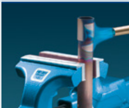
Typ F (Fiber)

Die Spannfläche besteht aus abriebfestem Filz, der sich weitgehend den Konturen der Werkstücke anpasst. Selbst empfindlichste Werkstücke werden ohne Beschädigung sicher gehalten.