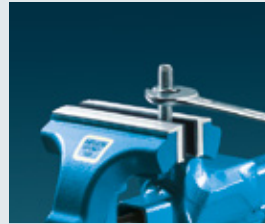
Typ G (Gummi)

Die Backen sind aus Polyurethan. Dieses sehr elastische, widerstandsfähige und alterungsbeständige Material nimmt nach Verformung durch Druck die ursprüngliche Form wieder an. Durch die eingearbeiteten Prismen in unterschiedlicher Größe werden die Werkstücke sicher gehalten.