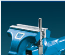
Typ P (Prismen)

Die Backen sind aus Aluminium in der Härte zwischen Kupfer und Blei. 6 Rillen halten das Werkstück sicher fest. Eine tiefere Rille dient zum sicheren Spannen von dünnen Wellen, Stiften und ähnlichen Werkstücken.