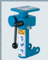
Пластина-переходник 4 (10мм) комплект для переоборудования